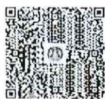
QR Code (Traffy Fondue)

(นายสุทธิพงษ์ จุลเจริญ) ปลัดกระทรวงมหาดไทย